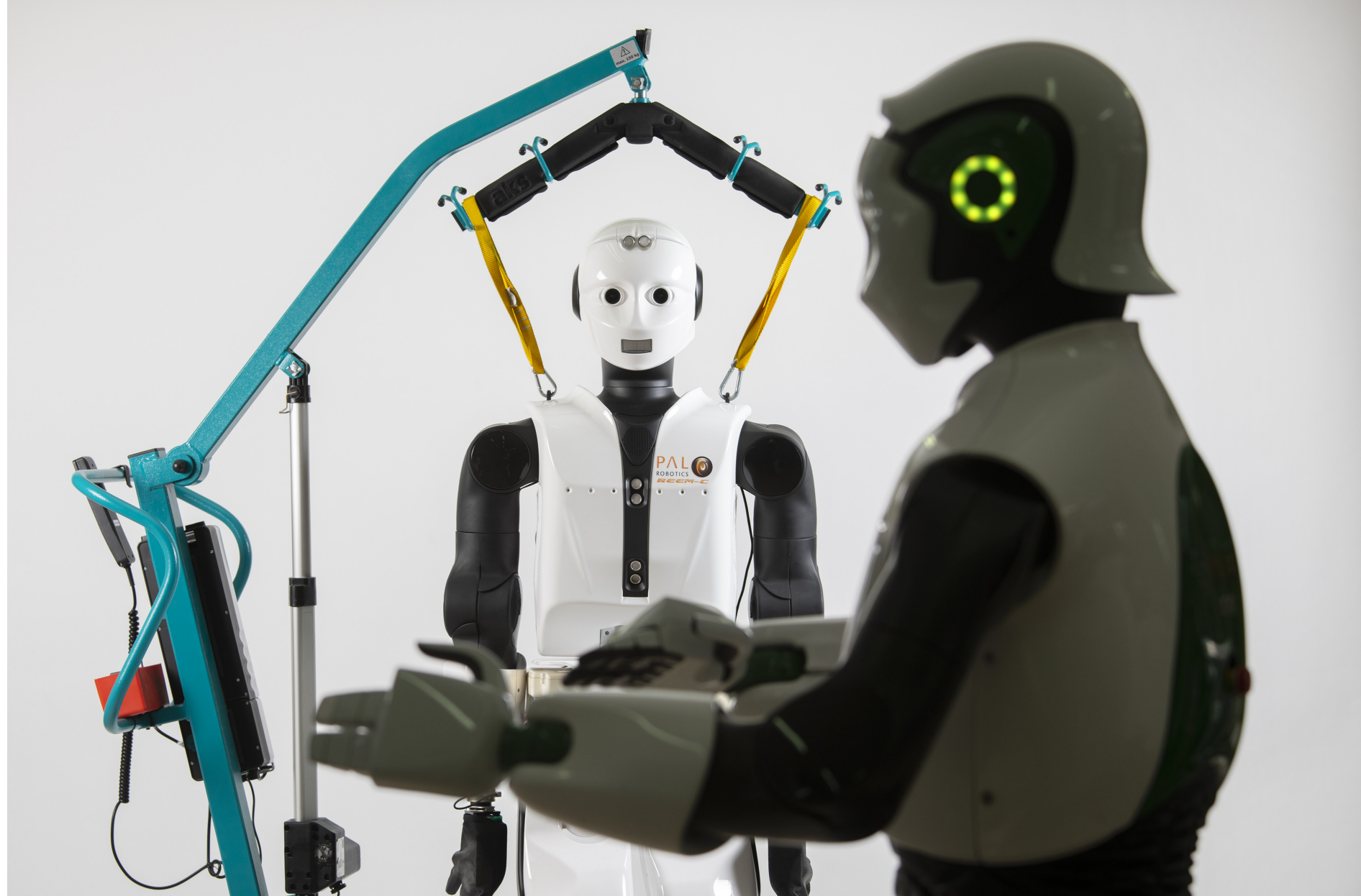
El aprendizaje automático de las máquinas sofisticará cada vez más su inteligencia, pero los expertos mantienen que los humanos no deben renunciar a tener el control

mejanza de la actriz Scarlett Johansson y otro llamado Michihito Matsuda, que se presentó en el 2018 como candidato a la alcaldía de un distrito de Tokio y quedó en tercera posición con 4.013 votos, se trata de episodios pintorescos. La batalla para que la IA despliegue su potencial camina por otros derroteros y se centra, según los expertos, en garantizar la privacidad de los datos y en reforzar el mensaje de que detrás de cada robot hay mujeres y hombres interesados en que las cosas vayan mejor que ahora.○