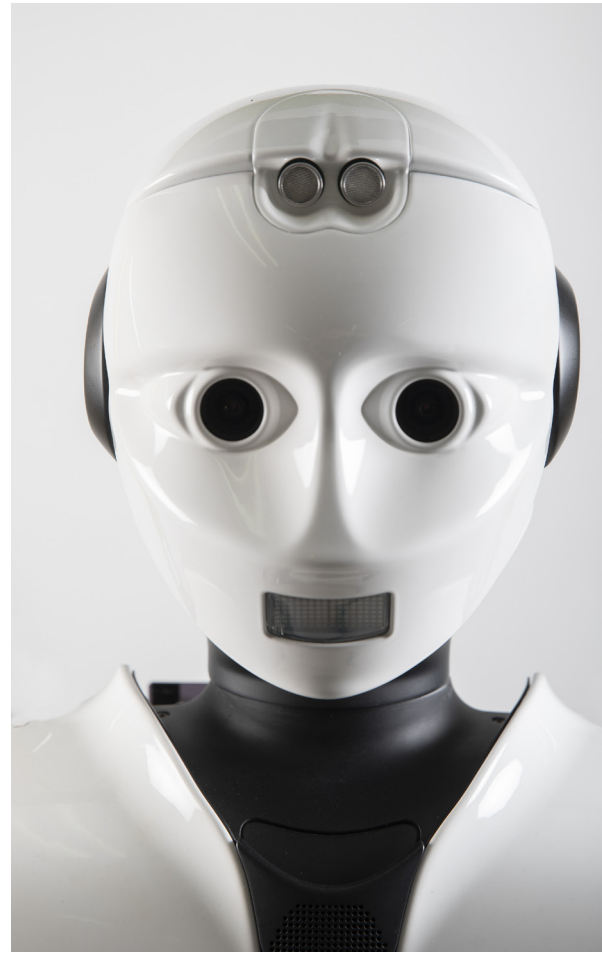
Uno de los dilemas entre los ingenieros, pero también entre los expertos de otras disciplinas, es hasta qué punto se deben humanizar los robots