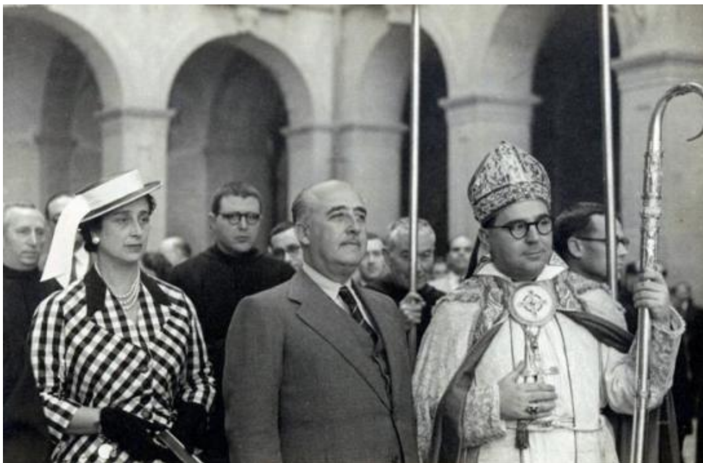
Francisco Franco y Carmen Polo junto al abad de Montserrat

La paz de Franco destruyó familias enteras, rompiendo las redes básicas de la solidaridad social, e impregnó la vida cotidiana de miedo y prácticas coercitivas. En muchos casos, las sentencias se impusieron a personas que habían sido ya castigadas con la muerte y recayeron sobre sus mujeres, madres y hermanas. Esa fue la “paz” de Franco.