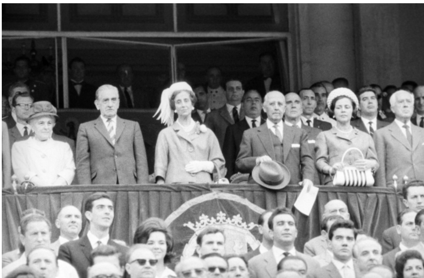
Carmen Polo y Francisco Franco en un espectáculo deportivo en 1964

Su primera influencia fue la religiosa, porque Franco no era al principio un hombre religioso. Lo fue luego cuando presentó el golpe de Estado y la posterior guerra civil como una cruzada. A partir de entonces, Franco comienza a rezar el rosario, incluso tiene un director de ejercicios espirituales. La segunda gran influencia fue la aristocratización. En los últimos cinco años de vida de Franco, fue Carmen Polo quien movió los hilos del régimen, en compañía de su camarilla. Polo no fue solamente "La Collares", como se la conocía, sino que su influencia fue mucho mayor conforme Franco envejecía.