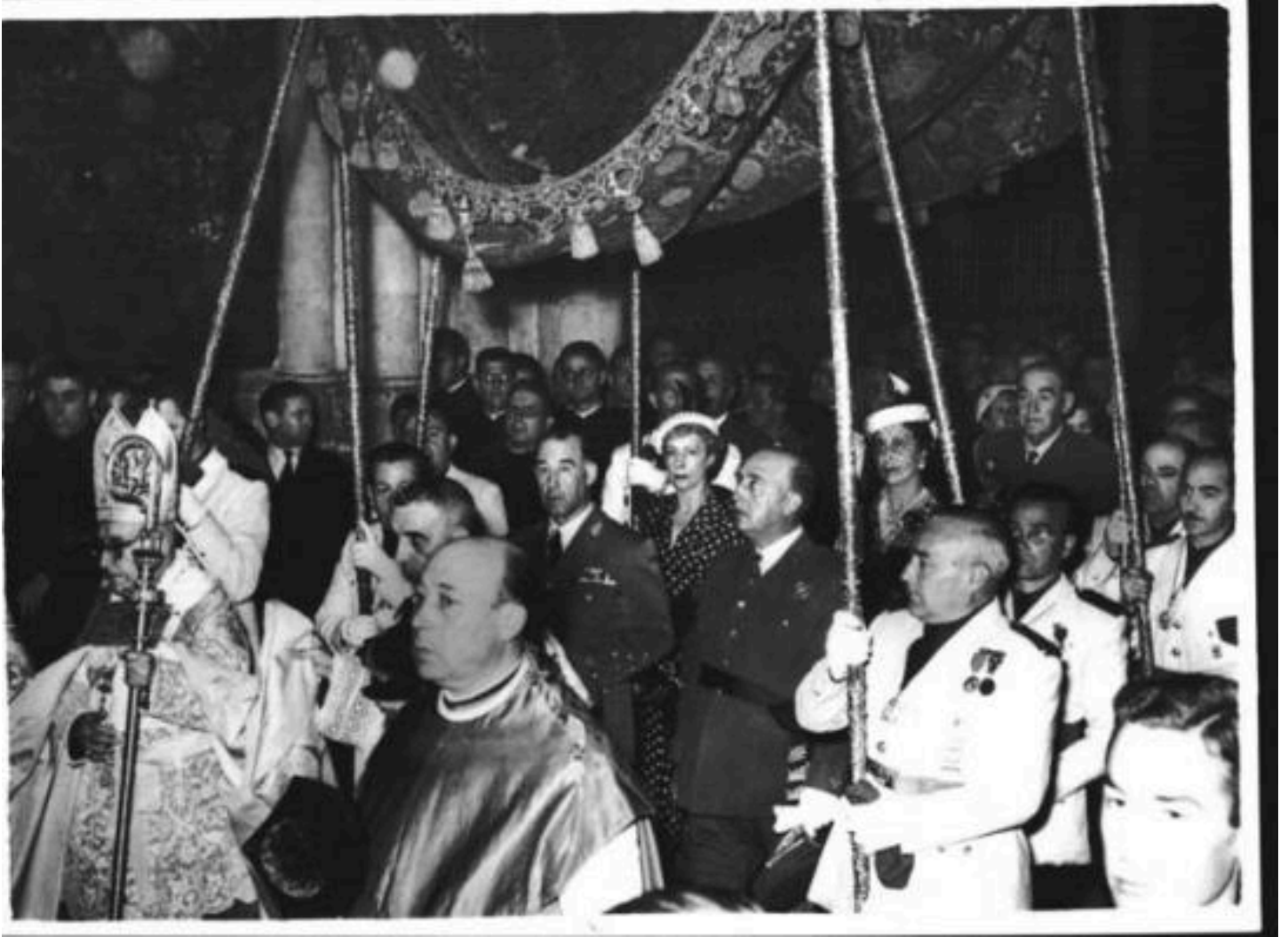
Franco bajo palio en Toledo durante los inicios de la dictadura (Otros)