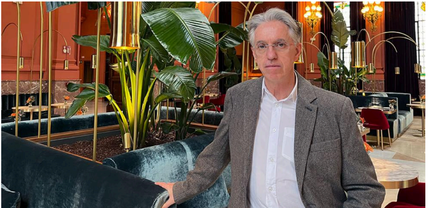
El historiador Julián Casanova en Barcelona para la presentación de su biografía de Franco (Editorial Crítica)

Julián Casanova, catedrático de Historia Contemporánea en la Universidad de Zaragoza y máximo especialista de la Guerra Civil y la posguerra, publica su biografía de Franco