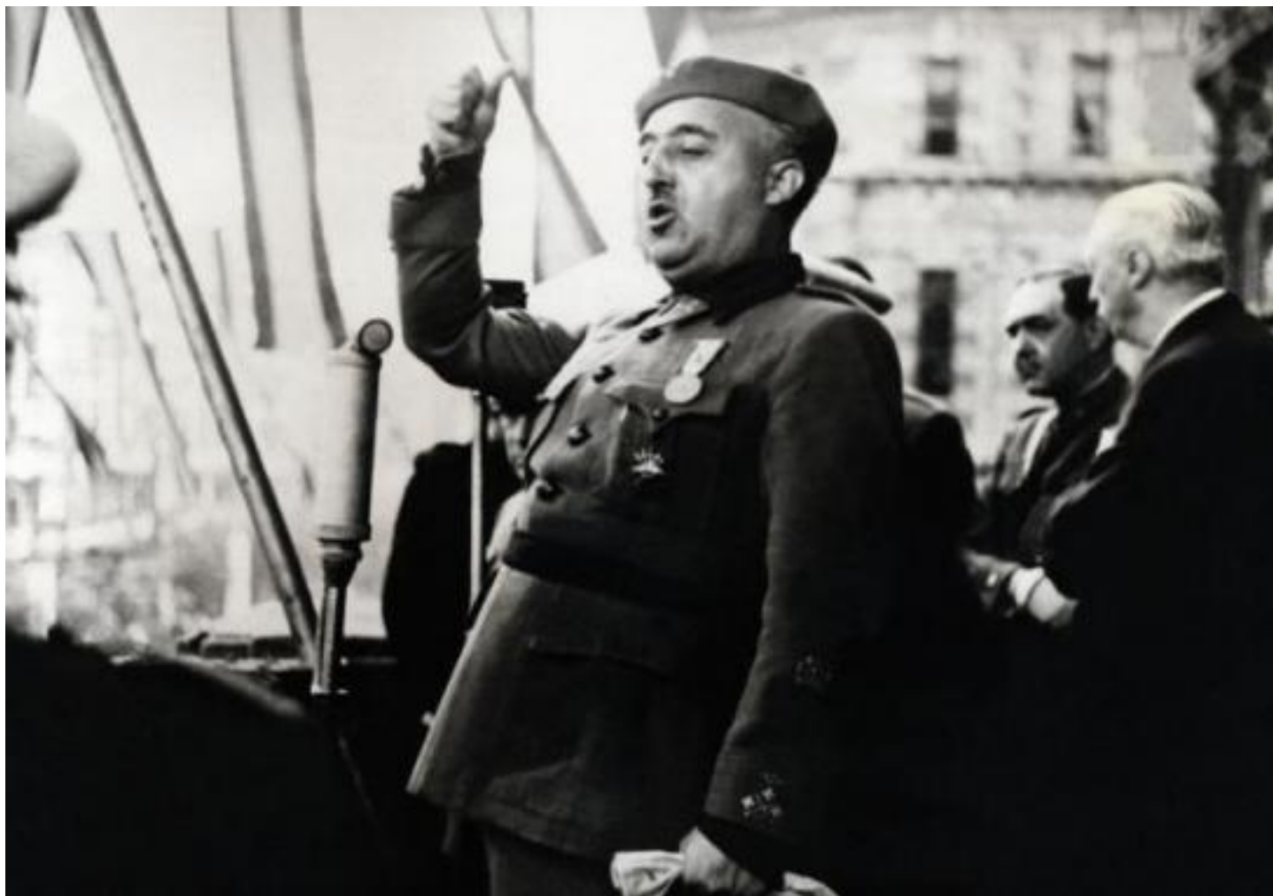
Franco durante un discurso en 1939