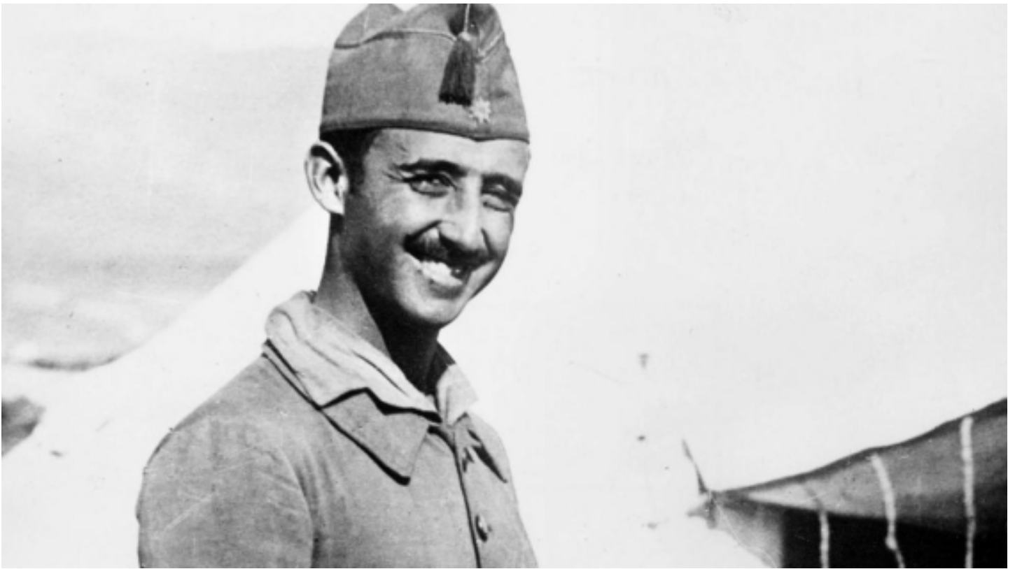
Francisco Franco como jefe de la primera bandera del Tercio de Extranjeros durante la guerra de Marruecos.