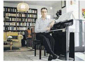
Pianista "Mi verdadero amor es la música", afirma el profesor. Abajo, representación de Platón

—Idealizan el dinero, idealizan el trabajo e idealizan el éxito. Pero