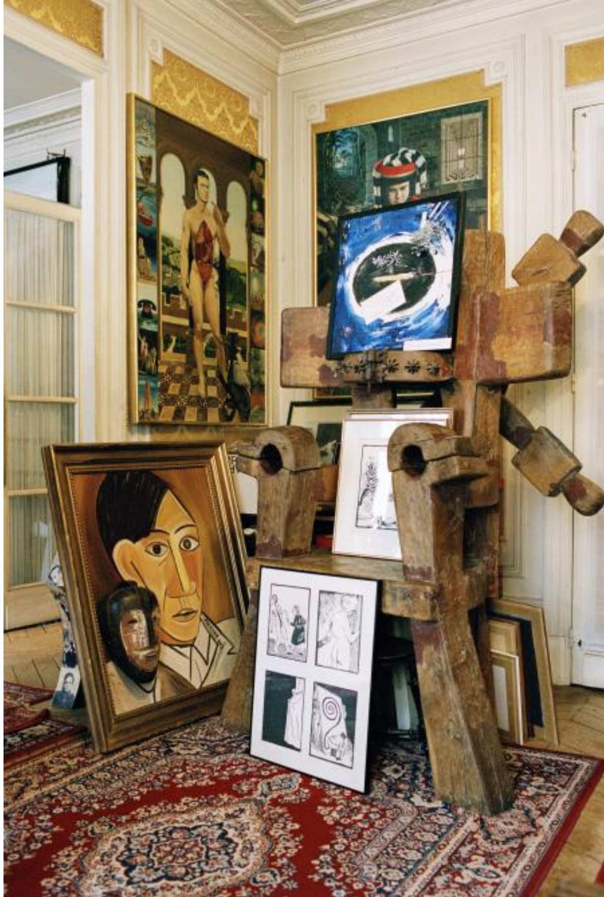
Casa de Fernando Arrabal, en el XVII distrito de París, cargada de arte y objetos Josep Fonti

Más preguntas: si se trata de descubrir el lenguaje no verbal que trasmiten las viviendas, ¿en qué hay que