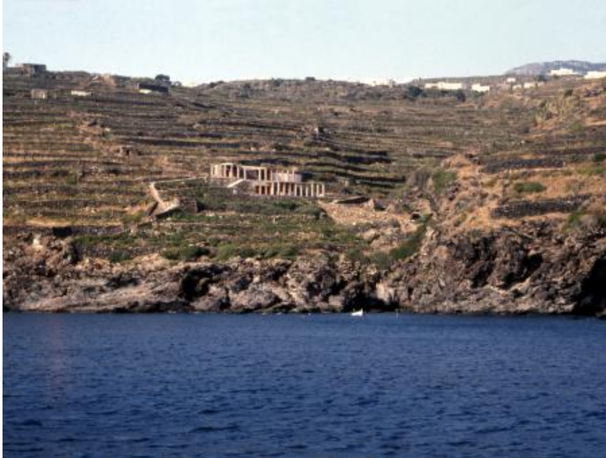
Casa de Óscar Tusquets en la isla de Pantelleria

Más allá de la indiscreción que presupone poder mirar por el ojo de la cerradura a vidas ajenas, hay tendencias que son extrapolables a los cinco continentes. "Hoy en día, casi todo el mundo de una cierta edad –argumenta Alegre– tiene una serie de ítems en sus casas: la plantita encima del ladrillo, los colores tierra, las cerámicas muy simples..." Y es que "ahora la casa de Nueva York, la casa de Barcelona o la casa de Marrakech tiene muchas cosas en común , porque la gente ve en internet que es mono y, al igual que ocurre con la moda, se contagia, a diferencia de lo que pasaba hace unos años cuando cada casa era un mundo y no había corrientes tan uniformadoras", concluye.