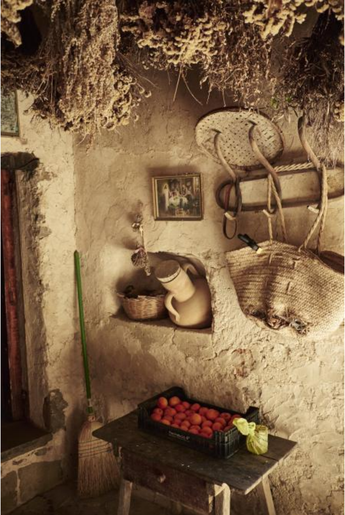
Casa rural de la arquitecta Armin Heinemann en Ibiza