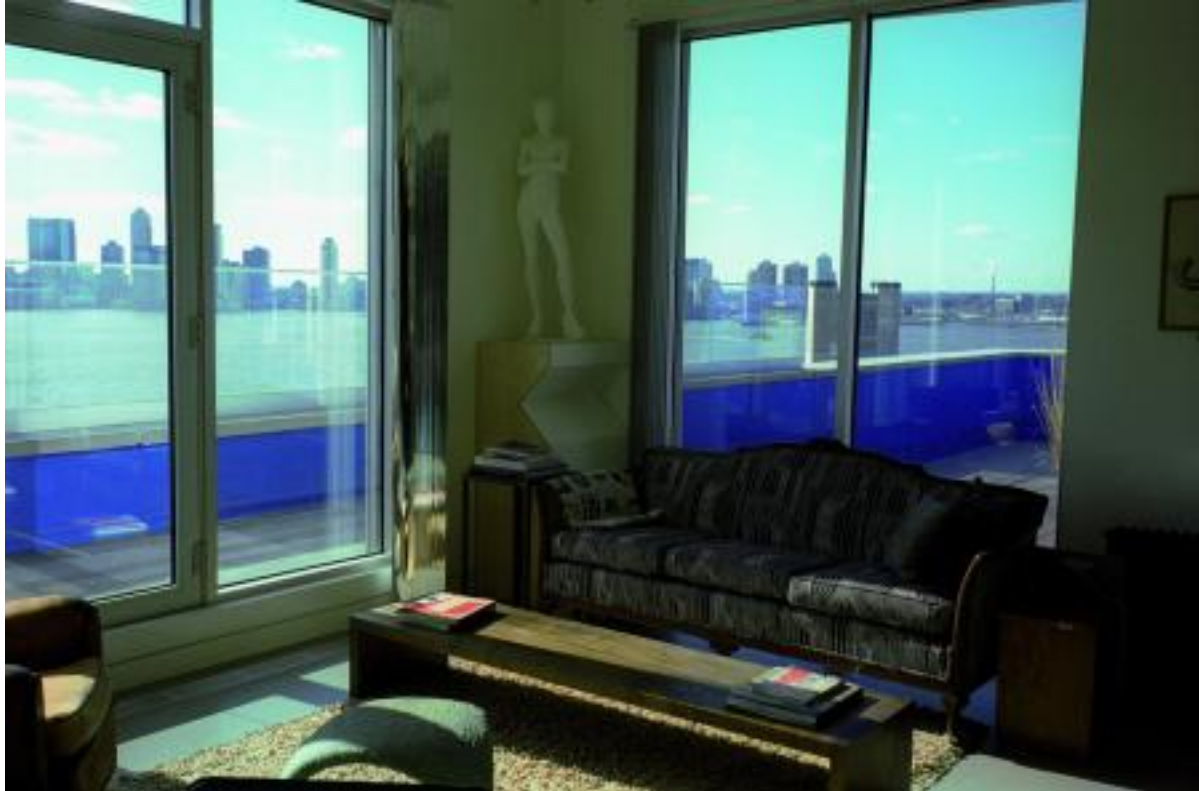
Apartamento de Michael Stipe, líder de REM, en Nueva York