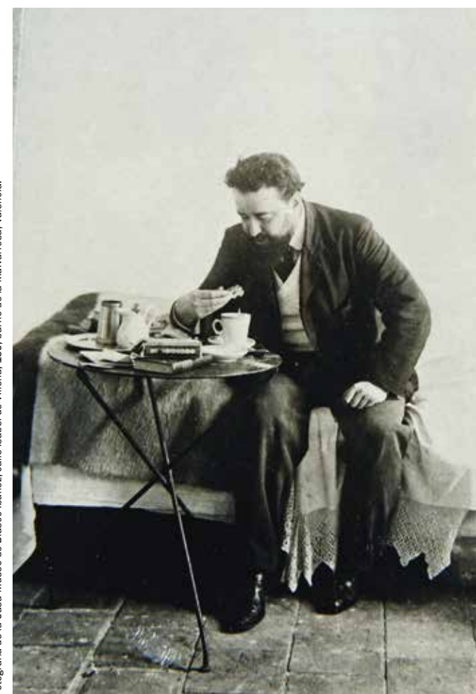
Fotografía de la Casa-Museo de Blasco Ibáñez, calle Isabel de Villena, 159, barrio de la Malvarrosa, Valencia.

A su lado , retrato de Nicomedes Méndez publicado por La Vanguardia el 16 de enero de 1892.