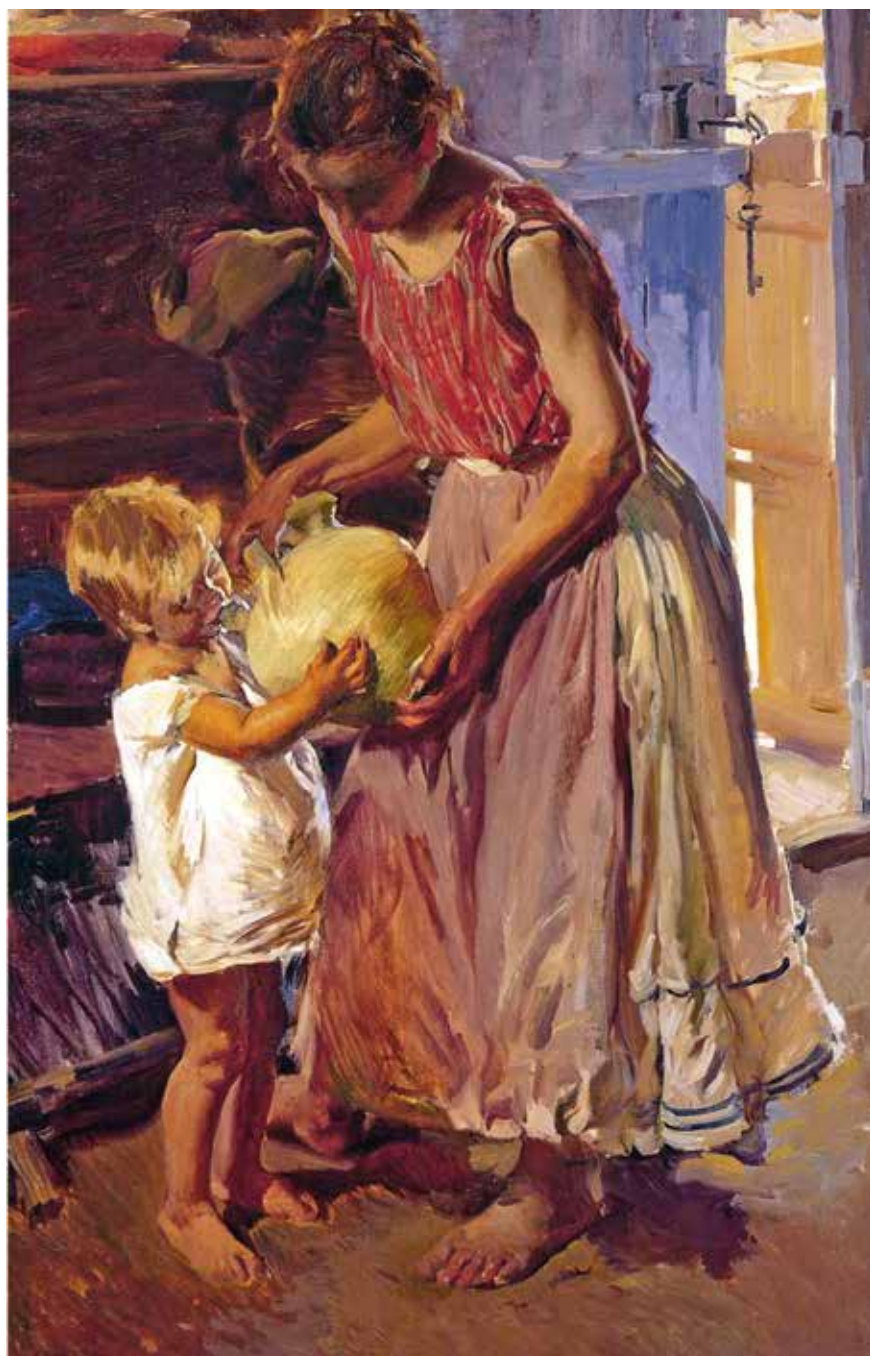
A la izqda., El botijo , obra de Joaquín Sorolla de 1904.

A la dcha., habitantes de Garrucha (Almería) aparcan sus carros junto a las fuentes mientras esperan su turno para cargar agua en 1962.