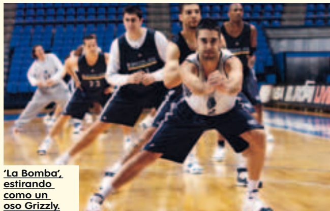
'La Bomba', estirando como un oso Grizzly.