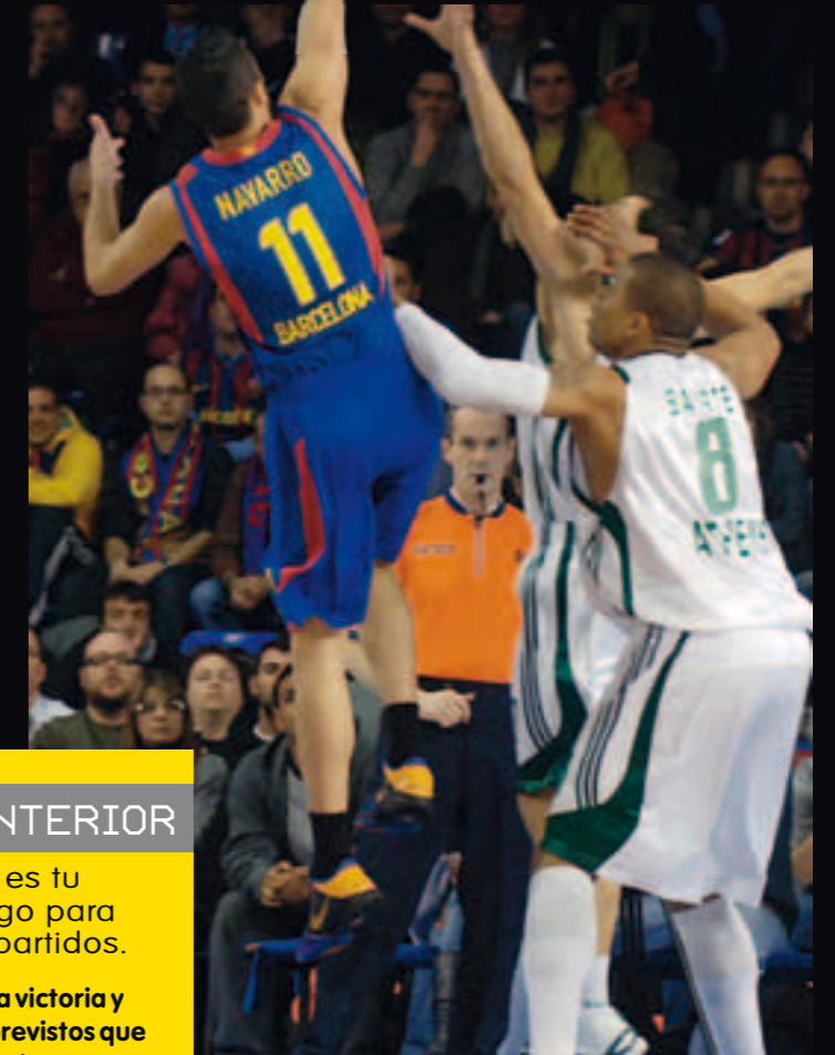
Entrando a canasta ante Panathinaikos en un partido de Euroliga.