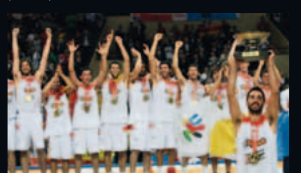
Levantando el trofeo de Campeones del Mundo (abajo).

"Nunca me acostumbré a perder. Por eso decidí regresar, para volver a ganar títulos. Siempre se puede engrosar el palmarés. ¿Cómo? Con otra Euroliga o con el oro olímpico"