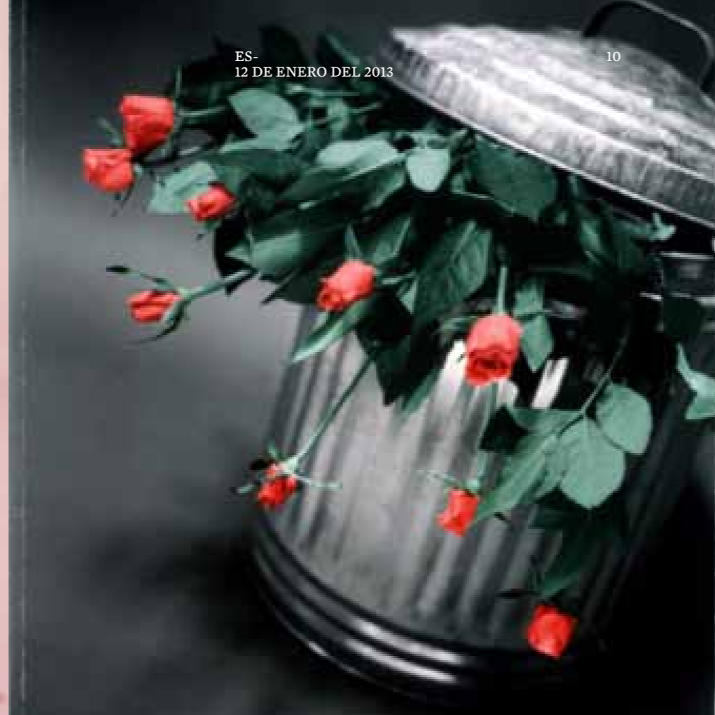
ES. 12 DE ENERO DEL 2013 10